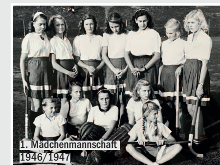
1. Mädchenmannschaft 1946/1947