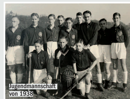
Jugendmannschaft von 1938