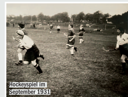
Hockeyspiel im September 1931