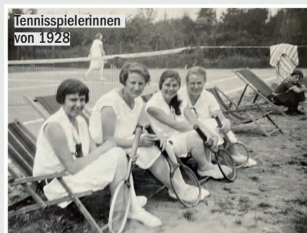
Tennispielerinnen von 1928