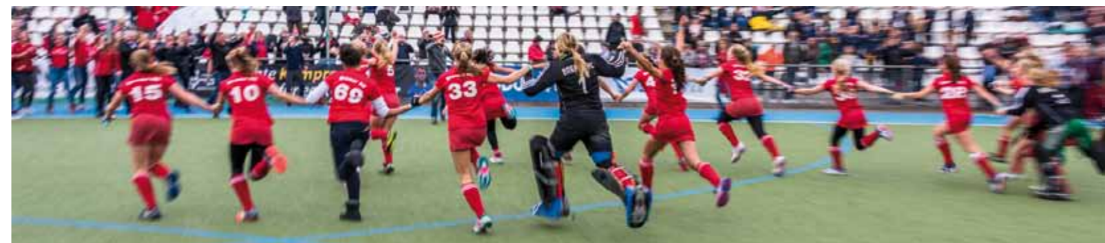
Deutscher Feld-Hockey-Meister MA 2014 · Deutscher Hallen-Hockey-Meister MA 2015 · Deutscher Feld-Hockey-Meister WJB 2015

Man kann nur schwer beschreiben, wie sich alle wahn-sinnig gefreut haben: Tränen, Kreischen, Umarmungen und vieles mehr waren dort zu sehen. Und dann kam erst das Beste: der Wimpel! Nachdem wir diesen erstmal ordentlich bestaunt hatten, ging es wieder zurück nach Bremen in den besten Verein. Dort wurde der Wimpel noch einmal richtig gefeiert! Für uns war das einfach ein bombastisches Wochenende, das wir niemals vergessen werden. Hier noch einmal ein dickes Dankeschön von uns an alle, die uns dabei unterstützt haben!