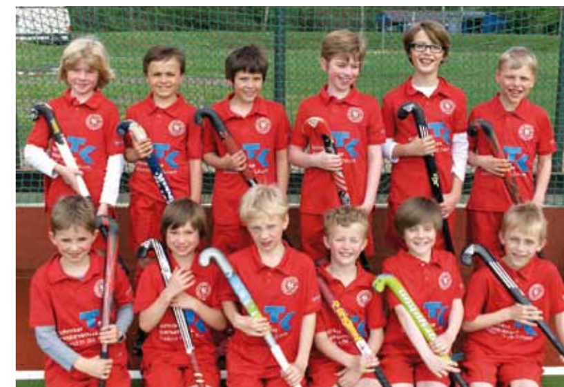
Mannschaftsfoto im Mai 2015

Umso ärgerlicher war es dann, dass ausgerechnet im Finale kein Sieg herausprang, nachdem man sogar lange Zeit 1:0 geführt hatte und erst kurz vor Schluss den Ausgleich gegen einen spielstarken, sympathischen und letztlich auch verdienten Sieger hinnehmen musste, der diesen Turniersieg einen Tick mehr wollte als wir (schon